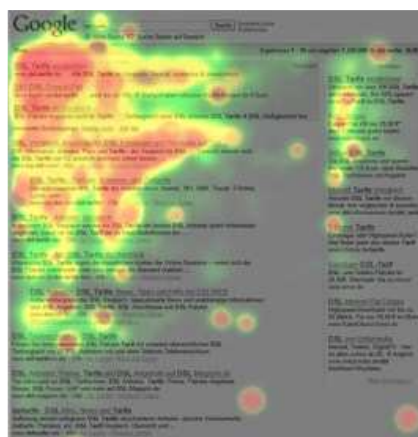
Heatmap aus Eyetrackingstudie

Prozentuale Verteilung der Klicks auf Suchmaschinenergebnisse bei Google